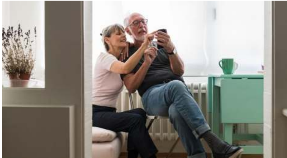
Mit der Unterstützung eines Maklers lässt sich der Immobilienverkauf entspannt realisieren.