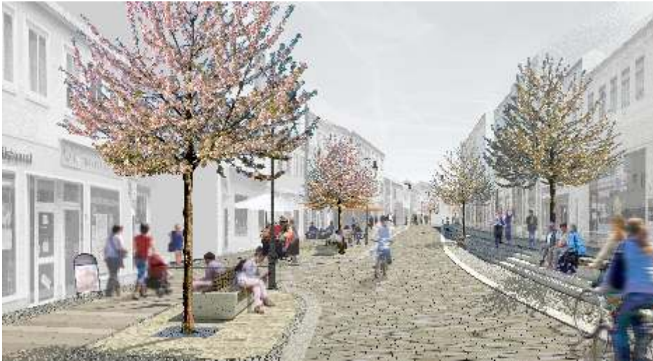
So attraktiv soll sich die Rochlitzer Straße bald präsentieren. Grafik: häfner jiménez betcke jarosch landschaftsarchitektur gmbh

Mittweida. Die Hauptgeschäftsstraße der Großen Kreis- und Hochschulstadt Mittweida – die Rochlitzer Straße – soll wieder attraktiver werden. Dazu sind in Absprache mit Gewerbetreibenden und Anwohnern umfangreiche Umgestaltungsmaßnahmen geplant, die ab 2. August mit dem Neugestalten der Heiste an der Kreuzung Rochlitzer-/Theaterstraße beginnen sollen. Ursprünglich sollte es bereits Anfang Mai los gehen. Nach zahlreichen Beratungen und Diskussionen, in die auch die Bevölkerung aktiv mit einbezogen wurde, konnte der Siegerentwurf von 2018 der Büros häfner jiménez betcke jarosch Landschaftsarchitektur GmbH aus Berlin und BDC Dorsch Consult Ingenieurgesellschaft mbH, ebenfalls aus Berlin, kontinuierlich zur Plan-Vorlage entwickelt werden, die schließlich vom Stadtrat beschlossen wurde. Die Umgestaltung soll 2021/22 ausgeführt werden und wird einen Investitionsaufwand von insgesamt