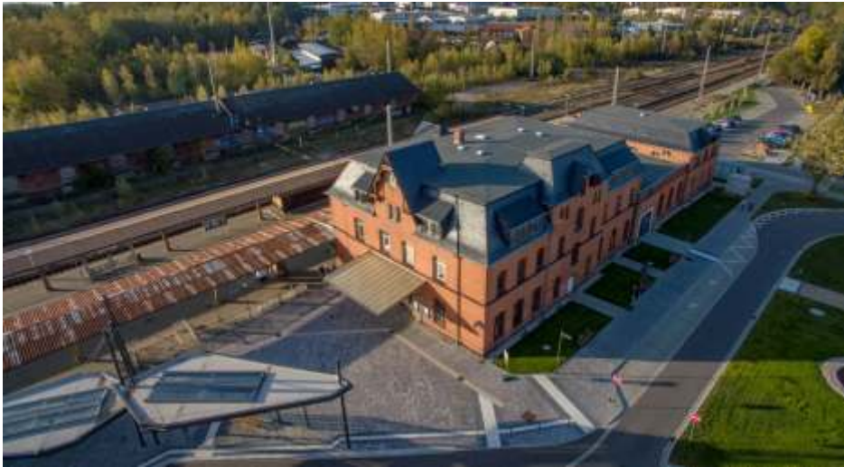
Luftaufnahme des Mittweidaer Bahnhofsareals.

Mittweida. Nach mehrjähriger Ruhe soll nun wieder Leben in das geschichtsträchtige, über 120 Jahre alte Bahnhofsgebäude von Mittweida einziehen. Der am 22. Mai 1900 eröffnete und unter Denkmalschutz stehende Bahnhofsbaus ist seit dem 21. September 2015 im Besitz der Stadt Mittweida, nachdem es ab 2013 einem russischen Investor gehörte. Der Bahnhof Mittweidas befindet sich im Westen der Zschopauastadt an der Bahn-Hauptstrecke Chemnitz – Riesa, die 1852 eingeweiht wurde. Der Mittweidaer Bahnhof war außerdem zwischen 1906 und 1997 Ausgangspunkt der vor allem im Güterverkehr genutzten Strecken Mittweida - Dreiwerden sowie Mittweida - Ringethal, der sogenannten Industriebahn, die mehrere an der Strecke liegende Großbetriebe, wie beispielsweise die Baumwollspinnerei und die Papierfabrik in Dreiwerden mit den verschiedensten Gütern und Materialien belieferte und dadurch zu einer Entlastung des zu dieser Zeit nur