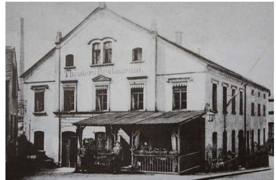
Der Vorgängerbau des heutigen Mittweidaer Kinos in der Theaterstraße in einer Aufnahme von etwa 1895.