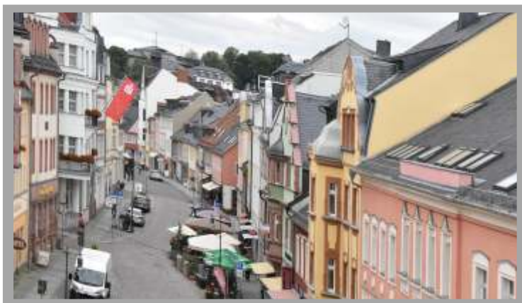
Blick in die Mittweidaer Hauptgeschäftsstraße – die Rochlitzer Straße –, die 2021/22 umgestaltet werden soll.