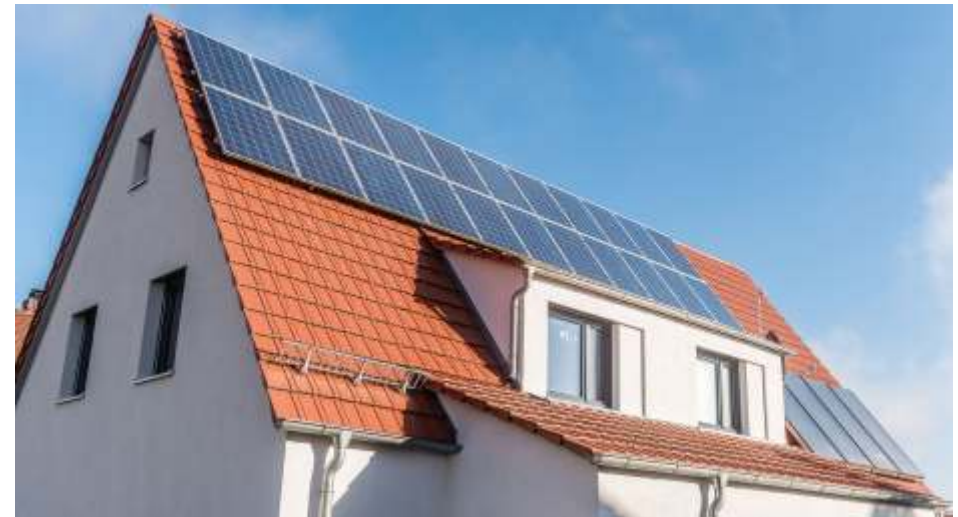
Auch nach 2025 dürfen Ölheizungen weiterhin eingebaut werden, wenn sie erneuerbare Energien mit einbinden.