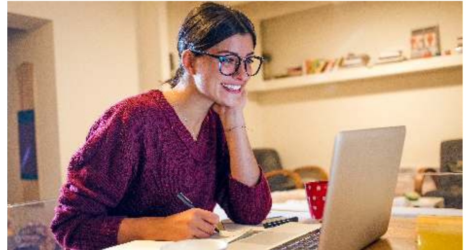
Arbeiten im Homeoffice: Wer mehr zu Hause ist als gewohnt, benötigt dort auch mehr Energie.