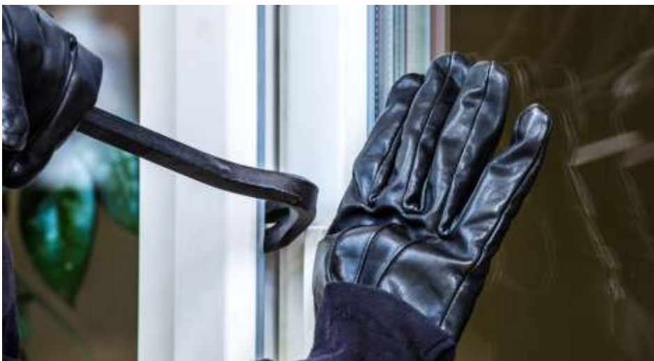
Einbruchdiebstahl ist laut Statistik die häufigste Schadensursache für die Hausratversicherung.